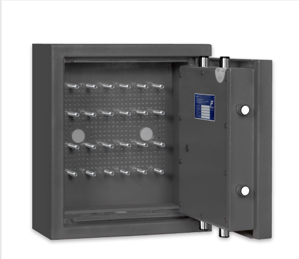
Beispielhafte Positionierung von der Haltebolzen an der Rückwand.

Bitte beachten Sie folgende Hinweise, bevor Sie die gummierten Haltebolzen an der Rückwand Ihres Tresors montieren: Sorgen Sie für eine ordnungsgemäße Verankerung Ihres STL 24 an der vorgesehenen Stelle! Beachten Sie hierzu unbedingt die Beschreibungen in der Bedienungs- und Montageanleitung Ihres Tresors.