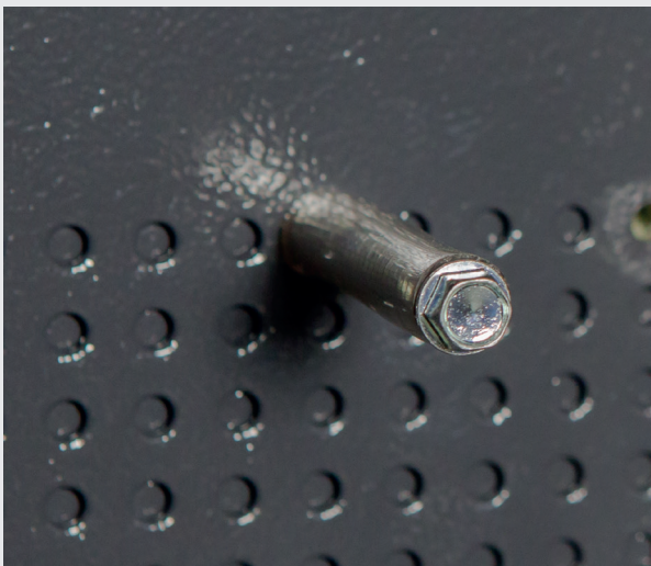
Festziehen der gummierten Haltebolzen mit einem 6kt. Steckschlüssel.

Achtung, Kippgefahr! Der Tresor kippt beim Öffnen der Tür, wenn er nicht verankert ist.